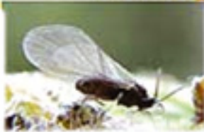
Günümüz yaprak biti

Dönem: Senozoik zaman, Eosen dönemi Yaş: 50 milyon yıl Bölge: Polonya