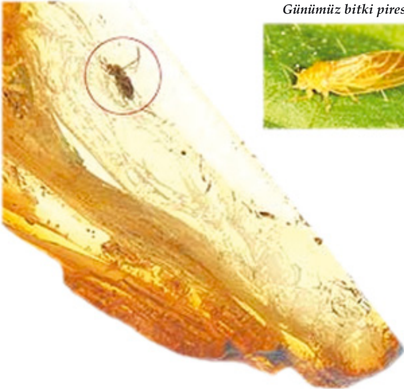
Günümüz bitki piresi