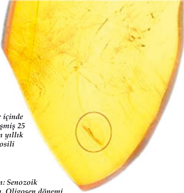
Amber içinde fossilleşmiş 25 milyon yıllık trips fosili

Tripsler, Thysanoptera takımına dahildirler. Var oldukları ilk andan bugüne kadar hiçbir değişikliğe uğramamışlardır. Fosil kayıtları bu gerçeğin en önemli kanıtıdır. Resimde de, 25 milyon yaşında bir trips fosili görülmektedir. Günümüzde yaşayan tripslerden hiçbir farkı olmayan bu fosil, evrimin geçersizliğini bir kez daha vurgulamakta, Yaratılış'ın apaçık bir gerçek olduğunu göstermektedir.