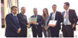
Gulf Helicopters AW fleet sets new operational milestones