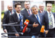
Orban rejects Merkel's 'moral imperialism' in refugee crisis