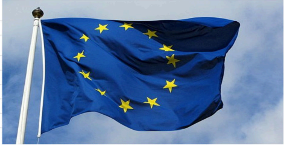
The flag of the European Union.