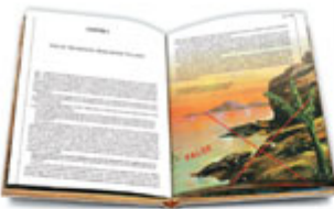
Seus pàgines de l'obra de Darwin (1859) sobre el creacionisme del Deu de l'evolució.

En síntesi, la manca d'una explicació científica per a un fenomen ha de ser un impuls per a investigar sobre ella. Però no ha de ser un argument per evitar-se, per a la classificació de la biologia.