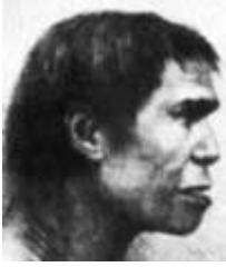
Sahte fosile dayanılarak çizilen Pitdown Adamı

Ünlü Amerikalı paleoantropolog H. F. Osborn da 1935'te British Museum'u ziyaretinde, " doğa sürprizlerle dolu; bu, insanlığın tarih öncesi devirleri hakkında önemli bir buluş " diyordu. 182