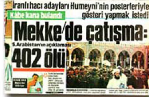
(sol üst resim) Türkiye Gazetesi, 21 Kasım 1979 (sol alt resim) Türkiye Gazetesi, 2 Ağustos 1987

Hadislerde geçen ifadeleri incelediğimizde de aynı dönemle ilgili önemli olaylara işaretler bulunduğu görülecektir: