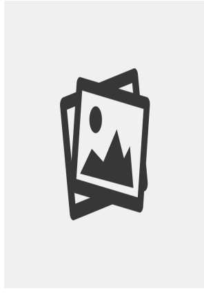
Alman Polis Günü sebebiyle hazırlanan posta kartı