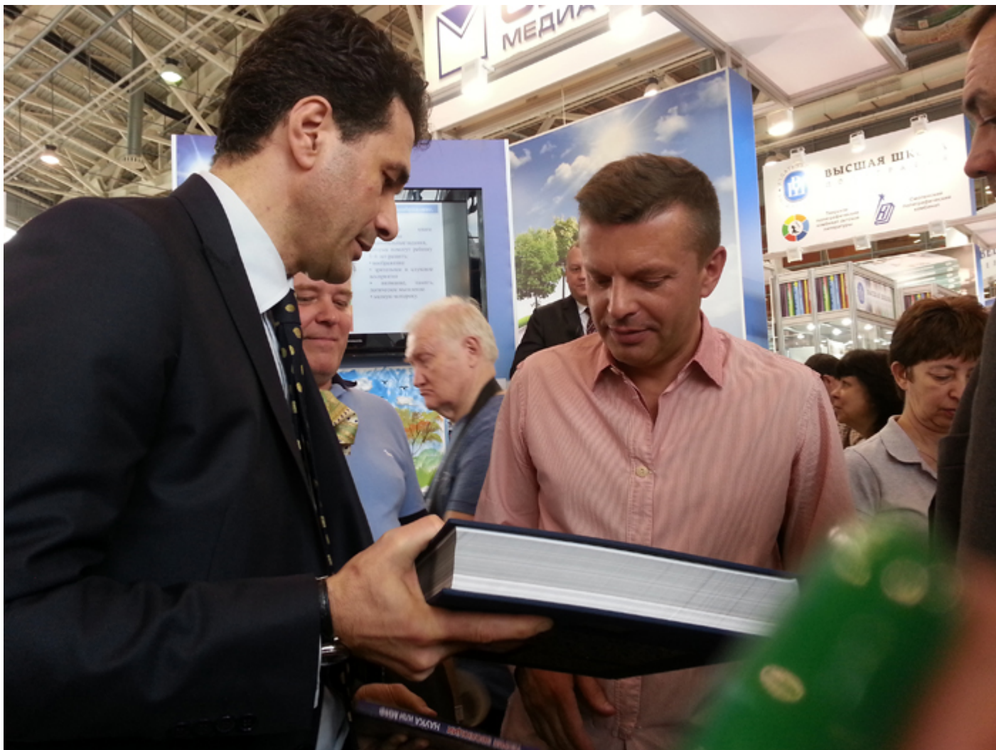
Leonid Parfenov – Russian journalist, TV Programmer, director and actor