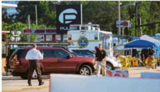
Law enforcement officers outside Pulse nightclub, three days after gunman Omar Mateen killed 49 people and injured 53 in its premises, in Orlando, Florida, in June. Mateen was a homosexual who carried out the shooting for revenge.