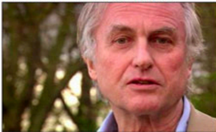
Evolutionary biologist Richard Dawkins has expressed his concern at the walkouts

One such lecture was given at UCL in 2008 and this year's talks have been given in London, Manchester, Leeds, Dundee and Glasgow.