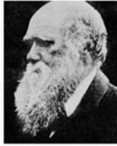
Conflict: An increasing number of Muslim biology students are boycotting lectures on the theories of Charles Darwin

Speakers regularly tour Britain lecturing on Yahya's beliefs.