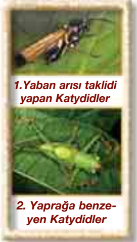
1.Yaban arısı taklidi yapan Katydidler

Yaban arısı Katydidleri kısa antenleri, neredeyse saydam, zarımsı ön kanatları ve dar karın bölgeleri ile en ince detayına kadar yaban arılarını taklit eder. Gerçek yaban arılarından tek farkları iğnelerinin olmamasıdır. Hatta duruşları bile gerçek yaban arılarından farksızdır. Taklit o kadar başarılıdır ki avcı hayvanlar, bu canlılara yaklaşmaya dahi cesaret edemezler. 6