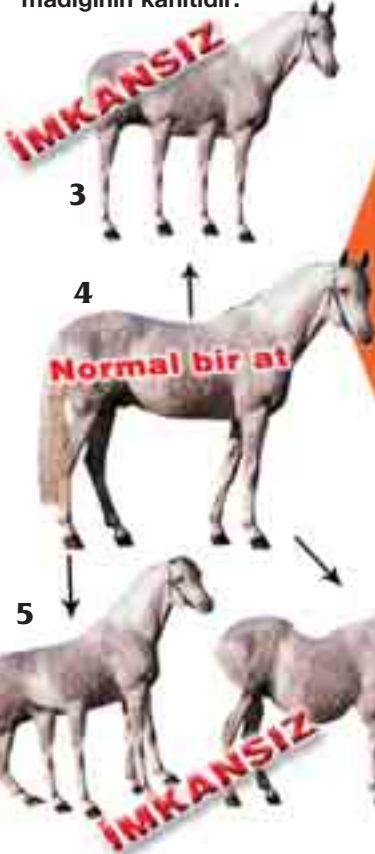
Resim 3: Fosil kayıtlarında hiçbir örneği olmayan hayali bir ara geçiş formu.

Bu, günümüzdeki at ile onun sözde atasının aynı zamanda yaşadığını göstermektedir ki, atın evrimi denen sürecin hiçbir zaman yaşanmadığının kanıtıdır.