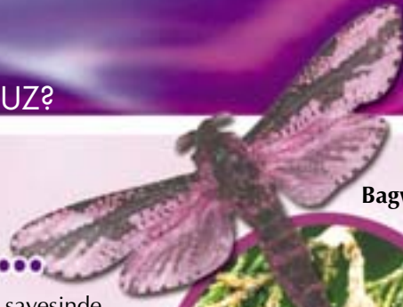
Bagworm güvesi ve çantası

cutlarındaki özel yaratılmış algılayıcılarını kullanarak kokuları fark edebilirler. Üstün ilim sahibi Allah tüm kainatı olduğu gibi bu canlıları da mükemmel sistemlerle yaratmıştır. Benzersiz şekilde yaratan Rabbimiz çok Yücedir.