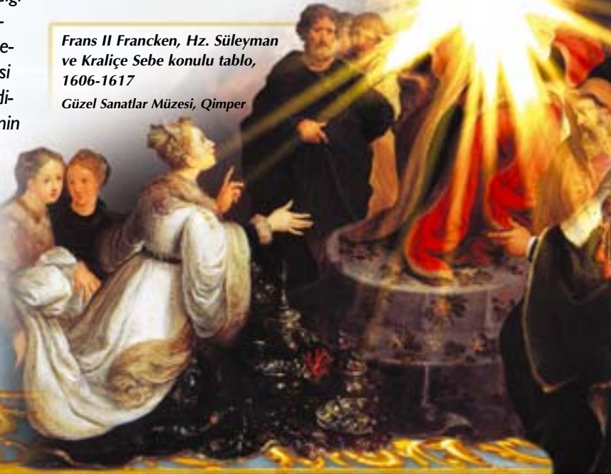
Frans II Francken, Hız. Süleyman ve Kraliçe Sebe konulu tablo, 1606-1617 Güzel Sanatlar Müzesi, Qimper

insanların alışık olmadığı bir tekniktir. Sebe Melikesi saraydaki ihtişamı görünce Hız. Süleyman’ın aklına, sanatına ve bilgisine teslim olmuş ve iman etmişti. (Neml Suresi, 44)