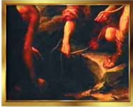
Yusuf Peygamberi kuyuya atan kardeşlerini kuyunun başında gösteren bir tablo

minlerin sevgi anlayışları bu şekildedir. Açık ki, Hz. Yakup da oğullarına sevgi yöneltirken bunu ölçü almıştır. Hz. Yusuf diğer oğullarından çok daha takva ve güzel ahlaklı olduğu için bu durumda onu en çok sevmesi son derece doğaldır. Fakat Hz. Yusuf'un kardeşleri bu gerçeği anlayabilecek bir ahlaka sahip olmadıkları için, babalarının Hz. Yusuf'a ve kardeşine olan sevgisini de anlayamamışlardır. Bu da onların Hz. Yusuf'u kıskanarak öldürmek istemelerine neden olmuştur.