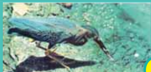
Ve kuş balıkları avlıyor...