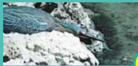
Balıklar yemin etrafında toplanıyorlar...