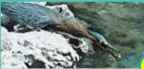
Yemi suya bırakıyor ve beklemeye başlıyor...