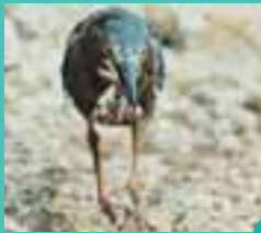
Kuş balıklara yem getiriyor...