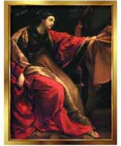
Tabloda Vezirin karısından yüz çeviren Hz. Yusuf'un iffetli davranışı tasvir edilmiştir.

"(Yusuf aracıya şunu söyledi): "Bu, (itiraf Vezirin) yokluğunda gerçekten kendisine ihanet etmediğimi ve gerçekten Allah'ın ihanet edenlerin hileli-düzenlerini başarıya ulaştırmadığını kendisinin de bilip öğrenmesi içindi. (Yine de) Ben nefsimi temize çıkaramam. Çünkü gerçekten nefis, -Rabbimin kendisini esirgediği dışında- var gücüyle kötülüğü emredendir. Şüphesiz, benim Rabbim, bağışlayandır, esirgeyendir." (Yusuf Suresi, 52-53)