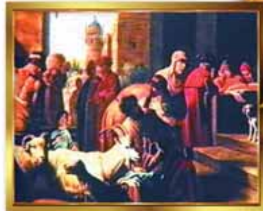
Hiz. Yusuf'u kuyuya atan kardeşleri, erzak almak niyetiyle yıllar sonra Hiz. Yusuf'un huzuruna çıkmışlardır. Yukarıda, bu anı canlandıran bir tablo.

Kuran'da Hz. Yusuf'un ise, kardeşlerine şu cevabı verdiği bildirilmiştir: