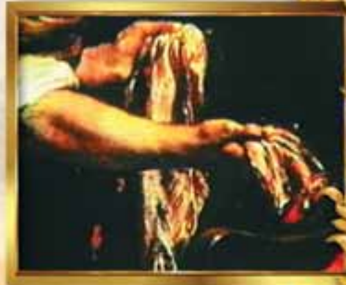
Bu tabloda, Hız. Yusuf'un kardeşleri, babaları Yakup Peygambere, Hız. Yusuf'u kurdun yediğini söylerken ve sahte delil olarak kanlı gömlek sunarken görülmektedir.

Ancak Hız. Yakup kendilerine inanmamış, onların oyunlarını fark etmiş ve bunun onlar tarafından düzülüp uydurulmuş bir yalan olduğunu açıkça ifade etmiştir. Bu durum Kuran'da şöyle bildirilmiştir: