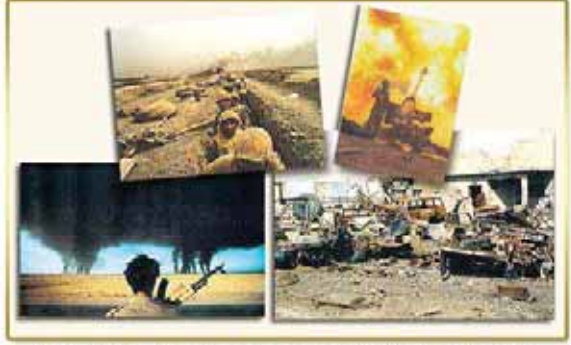
Fırat ile Dicle Arasındaki Büyük Savaş

Görüldüğü gibi Peygamberimiz (s.a.v.)’in sahih hadislerinden, büyük İslam alimlerinin bu hadislerle yaptıkları açıklamalardan dünyanın son devrinde olduğumuz net olarak anlaşılmaktadır. Bu durumda Hicri 1432 içinde olduğumuza göre, Peygamberimiz (s.a.v.)’in haber verdiği tarihi bilgi Hz. İsa (a.s.)’ın ve Hz. Mehdi (a.s.)’ın şu anda faaliyette olduğunu göstermektedir. Hz. Mehdi (a.s.)’ın zuhuru, İttihad-ı İslam’ın gerçekleşmesi, Hz. İsa (a.s.)’ın Hz. Mehdi (a.s.)’ın arkasında namaz kılması, tüm dünyaya İslam ahlakının hakim olması bu 70 yıl içinde gerçekleşecektir. Bundan sonra ise yeniden bozulma başlayacak, İslam ahlakı tamamen yeryüzünden kalkacak ve Allah’ın izniyle kıyamet kopacaktır. (Doğrusunu Allah bilir.)