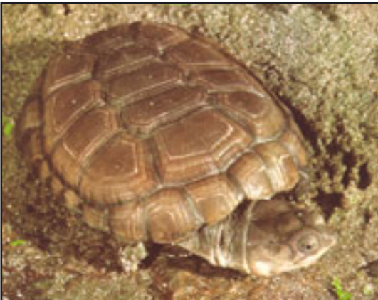
37-23 milyon yıllık kaplumbağa fosili (üstte)