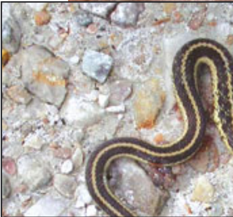
50 milyon yıllık yılan fosili (üstte)

(Yanda) Milyonlarca yıl önceki haliyle tıpatıp aynı olan günümüz yılanı görülmektedir.