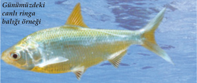
Günümüzdeki canlı ringa balığı örneği