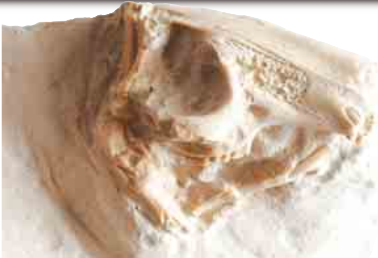
33 milyon yıllık tavşan kafatası fosili

Örümceklerin hep örümcek, arıların hep arı, vatozların hep vatoz olması gibi tavşanlar da hep tavşan olarak var olmuşlardır. Evrimin geçersizliğini gösteren sayısız fosil bulgusu karşısında, Darwinistlere düşen yenilgiyi kabul etmektir. Resimdeki 33 milyon yıllık tavşan fosili de, Darwinistlerin yenilgisini bir kez daha vurgulamakta, tüm canlıları Rabbimiz olan Allah'ın yarattığı gerçeğini göstermektedir.