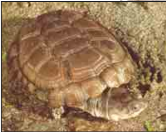
37-23 milyon yıllık kaplumbağa fosili (üstte)