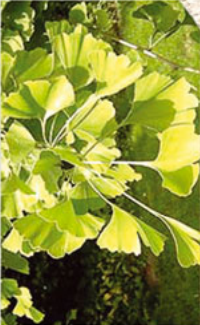
Günümüzdeki ginkgo yaprağı

Bölge: Cache Creek Oluşumu, British Columbia, Kanada