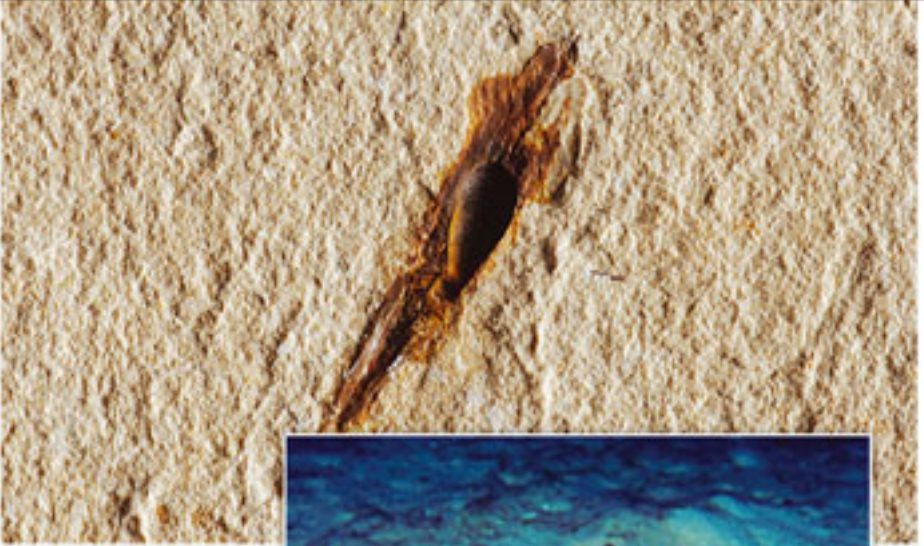
Mürekkep Balığı Dönem: Meozoik zaman, Kretase dönemi Yaş: 95 milyon yıl Bölge: Lübnan