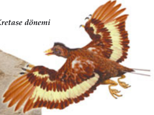
Confuciusornis 'in temsili resmi (üstte)