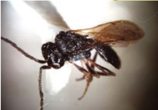
Dönem: Oligosen Yaş: 25 milyon yıllık Bölge: Santiago, Dominik Cumhuriyeti