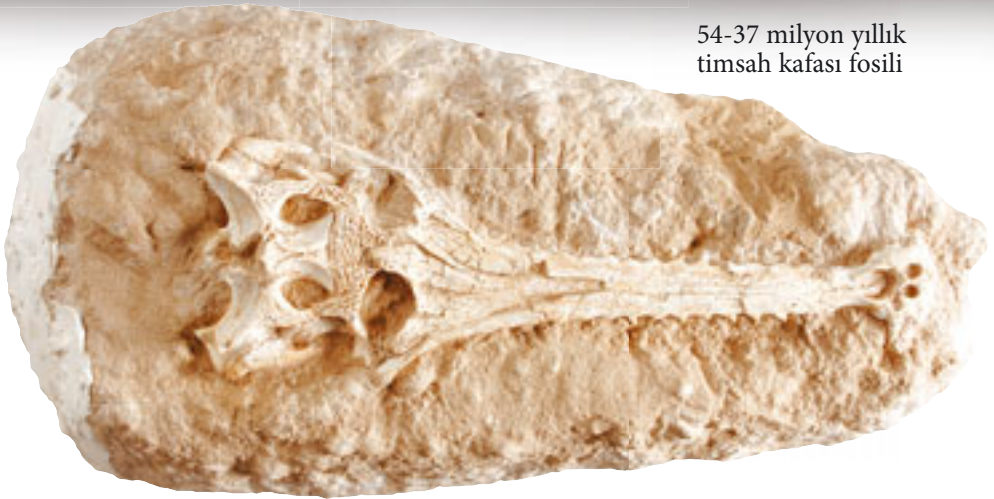
54-37 milyon yıllık timsah kafası fosili