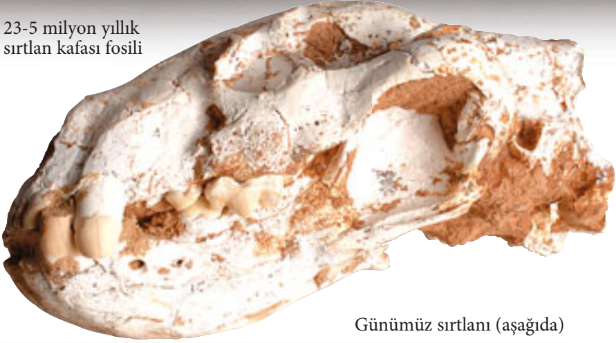
Günümüz sırtlanı (aşağıda)

23-5 milyon yıllık sırtlan kafası fosili