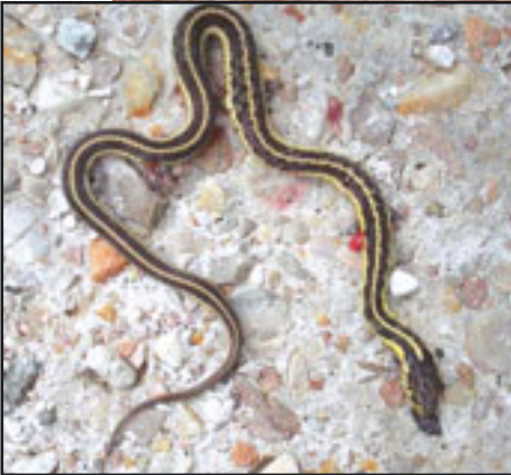
50 milyon yıllık yılan fosili (üstte)

(Yanda) Milyonlarca yıl önceki haliyle tıpatıp aynı olan günümüz yılanı görülmektedir.