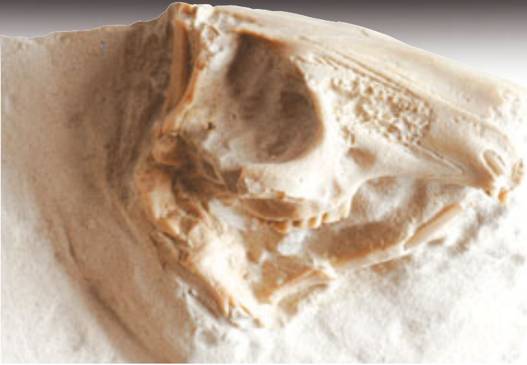
33 milyon yıllık tavşan kafatası fosili