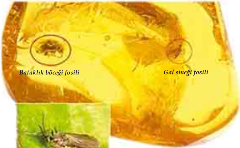
Bataklık böceği fosili