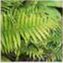
Günümüz eğrelti otu