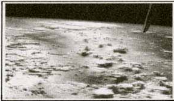
سوره آل عمران آیه ۱۹۰

جالب این است که مقدار اکسیژن مورد احتیاج جهت تنفس ، در هوا بصورت بسیار حساس ثبت و در حالت تعادل قرار گرفته اند . (( مایکل دنتون )) ۱ در این مورد می گوید : ' آیا اتمسفر ما می توانست با در برداشتن اکسیژن بیش از اندازه به حیات خود ادامه دهد ؟ خیر ! اکسیژن عنصری است که عکس العمل های شدید از خود نشان می دهد . حد نصاب ۲۱ درصدی اکسیژن موجود در اتمسفر ، در مرزی ایده آل قرار دارد و نباید از این مرز تجاوز کند . اضافه شدن حد نصاب ۲۱ درصدی به این ۲۱ درصد ، باعث می شود ۷۰ درصد آتش سوزیهای جنگلها در اثر رعد و برق افزایش یابد .