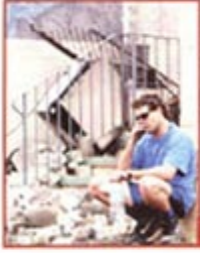
Avustralya tarihinin en büyük yangınında 3 ölü yüzlerce yaralı var...