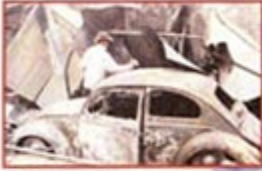
Yıldırım dikmesi sonucu, tarihinin en büyük yangınıyla karşı karşıya kalan Avustralya'da 400 ev yandı, 3 kişi öldü. Durumdan etkilenen yüzlerce kişi hastaneye kaldırıldı.