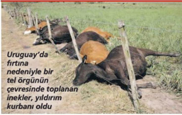
Uruguay'da fırtına nedeniyle bir tel örgünün çevresinde toplanan inekler, yıldırım kurbanı oldu

Yıldırım düşmelerinin neden olduğu olaylar arasında en dikkat çekenlerden biri 1998 yılında Kongo'da futbol sahasına düşen yıldırımın, sahada maç yapan 11 futbolcunun ölümüne neden olduğu olaydır. Yine benzer şekilde 2001 yılında Meksika'da futbol sahasına düşen yıldırım nedeniyle de 6 kişi hayatını kaybetmiştir. Bu olaylar dışında dünyada yıldırımların neden olduğu olaylar hala pek çok insanın hayatını kaybetmesine, hayvanların ve malların telef olmasına neden olmaktadır.