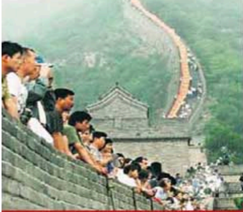
Arama kurtarma ekipleri 2 saat sonra talihsiz çifte ulaştığında, ikisinin de çoktan öldüğü belirlendi.

Bir yıllık evli 27 yaşındaki karı-koca kapalı olduğu halde girdikleri bir bölümde yıldırım çarpınca öldü. Talihsiz çift, 50 metre aşağı uçtu