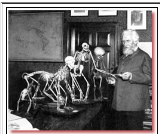
Avec ses dessins d'embryons falsifiés, Ernst Haeckel a trompé le monde scientifique pendant un siècle

Dans son livre Natürliche Schöpfungsgeschichte (L'histoire de la création naturelle) publié en 1868, Ernst Haeckel a soutenu qu'il avait fait des comparaisons variées en utilisant les embryons humains, de singes et de chiens. Les dessins qu'il a produits consistaient en des embryons presque identiques. En se basant sur ces dessins, Haeckel a soutenu que ces formes de vie avaient des ancêtres communs.