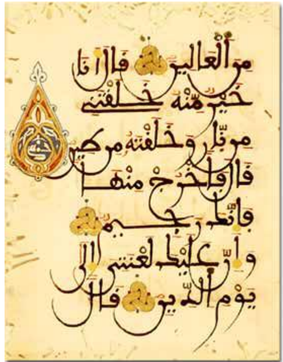
Un primo manoscritto del Corano.

In verità abbiamo voluto abbellire la terra di tutto quel che vi si trova per verificare chi di loro opera al meglio; e in verità, poi ridurremo tutto quanto in suolo arido. (Surat Al-Qaf, 6-8)