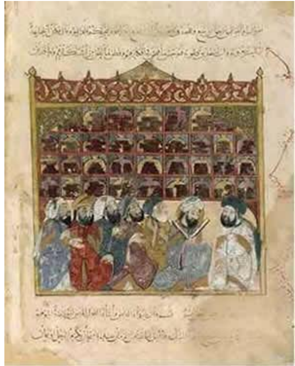
Studiosi Musulmani a Baghdad, la capitale scientifica mondiale dell'epoca

I grandi centri dell'istruzione religiosa erano anche centri di conoscenza e di sviluppo scientifico. Questi centri ufficiali sorsero nel periodo Abbasida (750-1258 d. C.) quando furono istituite centinaia di scuole moschee. Nel decimo secolo Baghdad aveva circa 300 scuole. Alessandria nel quattordicesimo secolo aveva 12.000 studenti. Fu nel decimo secolo che a Baghdad si sviluppò il concetto formale di Madrassah (scuola). La Madrassah aveva un curriculum e insegnavano a tempo pieno e a tempo parziale, molti dei quali erano donne. Ricchi e poveri ricevevano nella stessa maniera un'educazione gratuita. Da lì si svilupparono le Maktabat (biblioteche) e vennero acquistati libri stranieri. Le due più famose sono la Bait al-Hikmah a Baghdad (ca. 820) e la Dar al-Ilm al Cairo (ca. 998). Vennero anche istituite, molto prima che in Europa, università come Al-Azhar (969 d. C.). Il mondo Islamico creò le prime università - e perfino i primi ospedali - nel mondo.