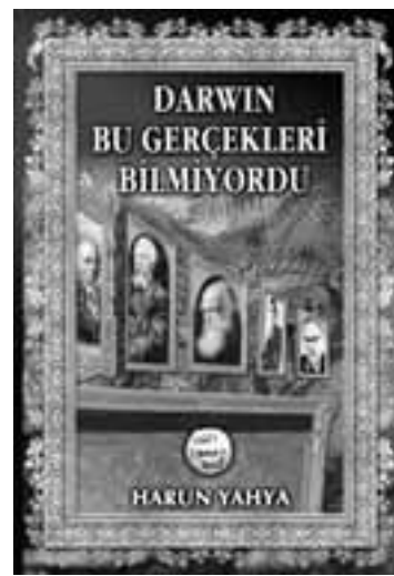
DARWIN BU GERÇEKLERİ BİLMİYORDU