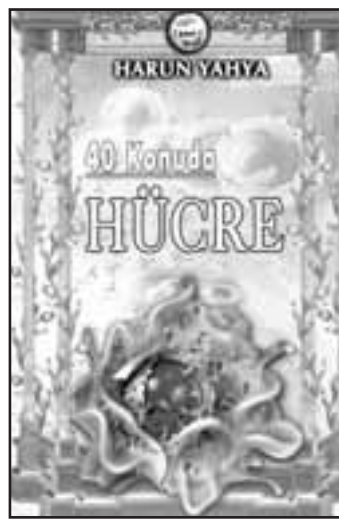
40 KONUDA HÜCRE

EVİRİM ALDATMACASI HAYATIN GERÇEK KÖKENİ EVİRİMLERE NET CEVAP 1-4 DARWİN'İN TÜRK DÜŞMANLIĞI EVİRİM AÇMAZI (ANSİKLOPEDİK 2 CİLT) BİR ZAMANLAR DARWİNİZM 20 SORUDA EVİRİM TEORİSİNİN ÇÖKÜŞÜ DARWİNİZM'İN İNSANLIĞA GETİRDİĞİ BELALAR DARWİN'İN TÜRK DÜŞMANLIĞI BİR TARTIŞMANIN ARDINDAN 50 MADDEDE EVİRİM TEORİSİNİN ÇÖKÜŞÜ KAINATTAKİ KUSURSUZ TASARIM TESADÜF DEĞİL DARWİNİZM'İN KARANLIK BÜYÜSÜ EVİRİMLERİN YANILGILARI SOSYAL SİLAH DARWİNİZM KURAN DARWİNİZM'İ YALANLIYOR AMERIKAN ULUSAL BİLİMLER AKADEMİSİ'NİN YANILGILARI DARWİNİZM KANLI İDEOLOJİSİ: FAŞİZM VARILCI DARWİN TÜRLERİN EVİRİMİ YANILGISI DARWİNİZM DİNİ ARAGEÇ AÇMAZI EVİRİMLERİN İTİRAFLARI DARWİNİZM'İN SONU DARWİN YALAN SÖYLEDİ! KUŞLARIN VE UÇUŞUN KÖKENİ