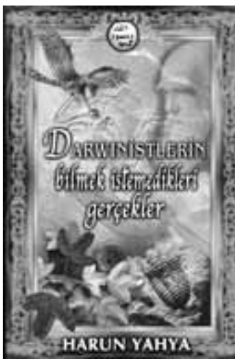
DARWİNİSTLERİN BİLMEK İSTEMEDİKLERİ GERÇEKLER