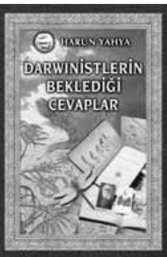
DARWİNİSTLERİN BEKLEDİĞİ CEVAPLAR